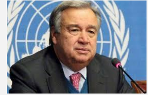
MALESTAR POR LA DESIGUALDAD DURANTE LA RUEDA DE PRENSA EN NUEVA YORK

https://www.europapress.es/nacional/noticia-audiencia-nacional-trata-acotar-cupula-violencia-callejera-cataluna-atribuida-tsunami-cdr-20191025175223.html