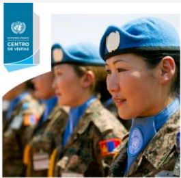
BIENVENIDOS A LAS NACIONES UNIDAS

https://www.un.org/es/events/devinfoday/